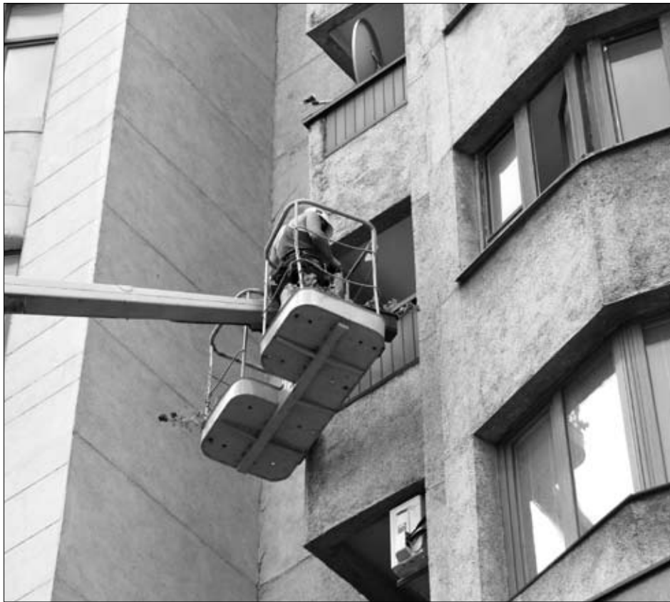
В случае систематического нарушения правил «социалистического сожительства» бывший супруг может быть выселен без предоставления другого жилья

Правовые основания на пользование бывшими супругами жильем, приобретенным в браке, предусмотрены в Жилищном кодексе (ЖК) УССР. Часть 4 статьи 156 этого Кодекса гласит, что прекращение семейных отношений с собственником дома (квартиры) не лишает членов семьи собственника дома (квартиры) права пользования занимаемым помещением. Статья 64 ЖК УССР к членам семьи собственника дома (квартиры) относит жену нанимателя, их детей и родителей, а также других лиц, которые могут быть признаны членами семьи нанимателя, если они постоянно проживают вместе с нанимателем и ведут с ним совместное хозяйство. Некоторые разъяснения относительно применения норм Жилищного кодекса при разрешении споров, связанных с пользованием жилыми помещениями в домах и квартирах, принадлежащих гражданам