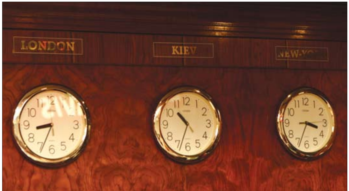
«Запуск» 60-дневных часов на инициирование арбитража в GAFTA и FOSFA осуществляется по-разному

Согласно статье 12 Английского арбитражного акта 1996 года, сторона может обратиться в суд для продления сроков инициирования арбитража, если она прошла